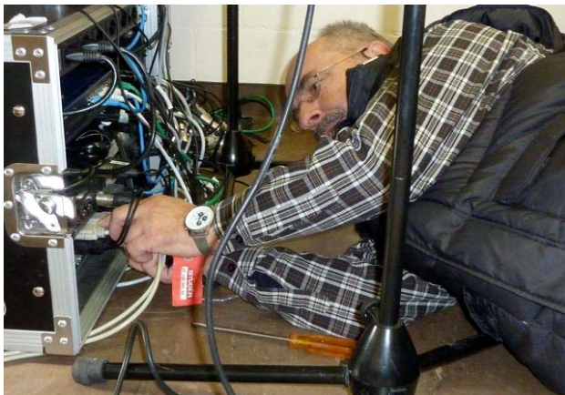
Installation des mobilen Radiostudios am JUSKILA 2011

Sourires, éclats de rire, bonne humeur... C'est ça le lot quotidien d'un séjour à la Lenk avec JUSKILA!