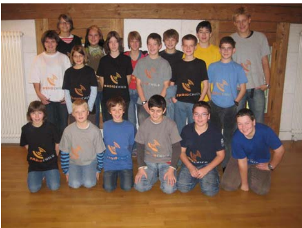
Die Schule Bächlen-Horben-Riedern aus dem Diemtigtal; alle SchülerInnen tragen ein RadioChico T-Shirt