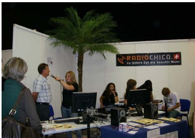
Das mobile Studio an der SuisseToy in Bern