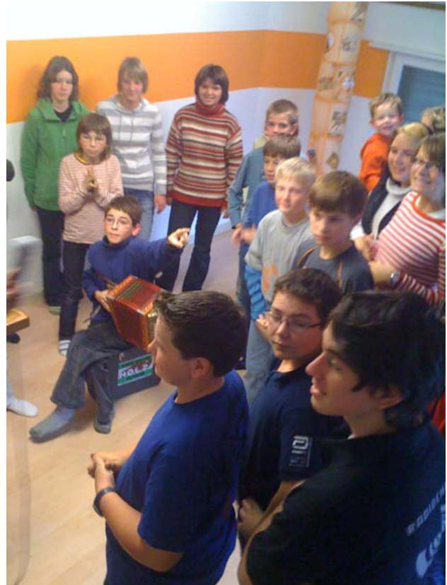
Der „BäHoRi-Beat“ wird im RadioChico Schweiz Studio in Goldbach aufgenommen

erstaunlich und erfrischt durch seine Mischung von Beat, Rapp und Jodeln. Der Text ist sehr „Diemtigtalisch“ und erfreuend. Es ist das erste Mal, dass es während einer Schulprojektwoche bei RadioChico so viele Volksmusiköne gab und sogar eine eigene Kreation entstand.