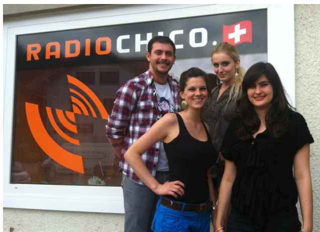
Das neue RadioChico Team in Goldbach